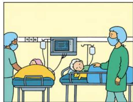
Salle de réveil